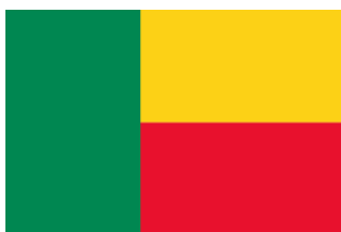
RÉPUBLIQUE DU BÉNIN

Le Bénin est un pays d'Afrique occidentale, qui couvre une superficie de 112 622 km 2 et s'étend sur 670 km, du fleuve Niger au nord à la côte atlantique au sud. Il a comme voisins le Togo à l'ouest, le Nigeria à l'est et le Niger et le Burkina Faso au nord.