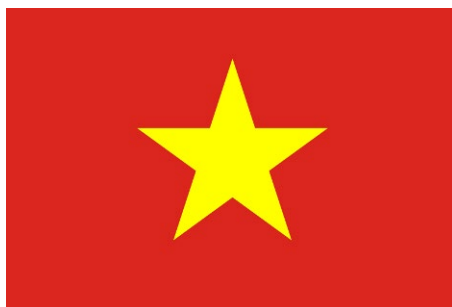
RÉPUBLIQUE SOCIALISTE DU VIETNAM

Le Vietnam est un pays de 331 700 km 2 (partie continentale). Sur la carte du monde, le Vietnam forme un S long et étroit, gonflé aux deux extrémités.